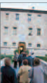
Ingresso al palazzo